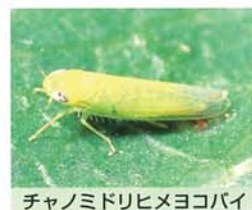
チャノミドリヒメコバチ