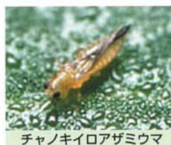
チャノキイロアザミウマ